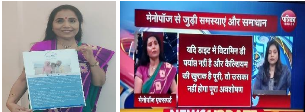
https://www.facebook.com/rajasthanpatrika TV show, Newspaper article

Public awareness campaigns: via Media globally Poster & leaflet release